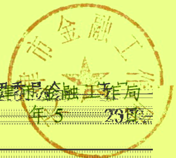
天津市金融工作局