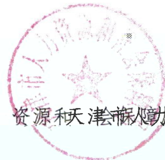
天津市人力资源和社会保障局