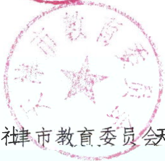
天津市教育委员会